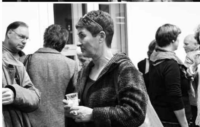
Vor der Debatte ist nach der Debatte: Angeregte Diskussionen im Anschluss an das Symposium.