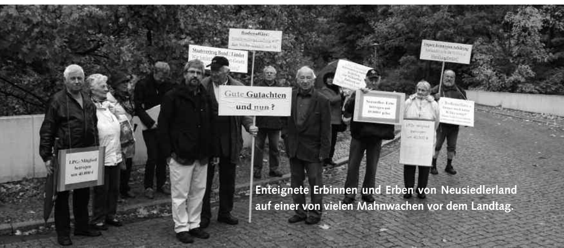
Enteignete Erbinnen und Erben von Neusiedlerland auf einer von vielen Mahnwachen vor dem Landtag.

Mit dem 2. Vermögensrechtsänderungsgesetz von 1992 und abhängig von der Umsetzungspraxis in den Ländern standen viele dann plötzlich vor dem Nichts. Mehr noch: Im Vertrauen auf ihre Eigentümerposition wurde häufig der Rechtsweg beschritten; am Ergebnis änderte dies in der Regel nichts, bis auf die zusätzliche finanzielle Last durch entsprechende Verfahrenskosten.