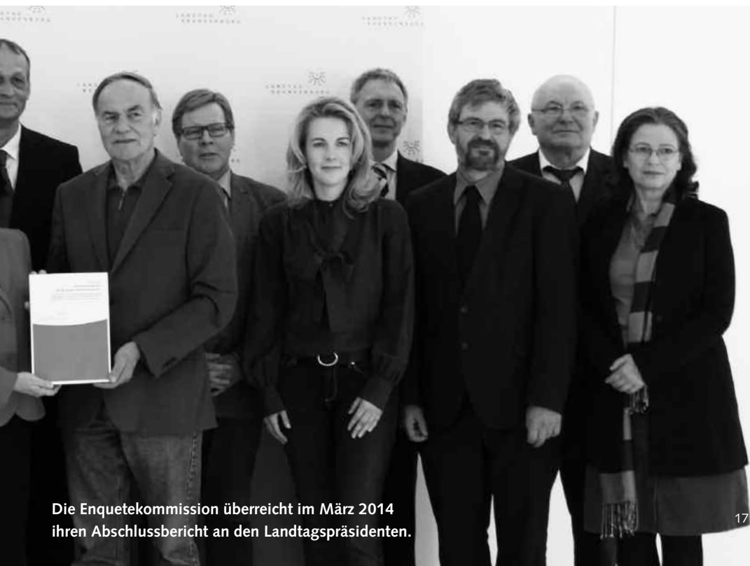
Die Enquetekommission überreicht im März 2014 ihren Abschlussbericht an den Landtagspräsidenten.

Vorstellung und Diskussion des Abschlussberichts im Landtagsplenum