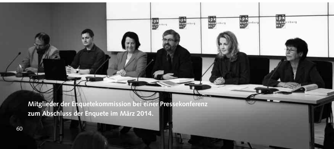
Mitglieder der Enquetekommission bei einer Pressekonferenz zum Abschluss der Enquete im März 2014.

Die Enquetekommission 5/1 empfiehlt eine ernsthafte Debatte über das DDR-Zwangsdoping und dessen Folgen für die Betroffenen bis zum heutigen Tag. Der Landessportbund wird aufgefordert, konkrete Initiativen für Dopingopfer zu entwickeln und dabei auch eine geeignete Interessenvertretung der Dopingopfer weitgehend zu unterstützen und die zugesagten Mittel auszureichen."