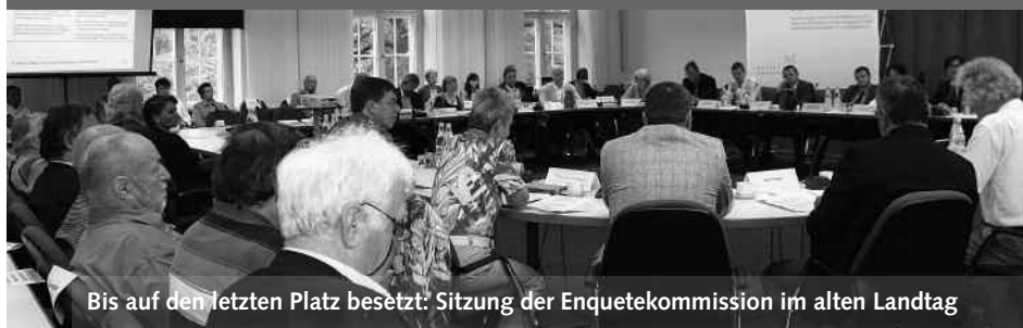
Bis auf den letzten Platz besetzt: Sitzung der Enquetekommission im alten Landtag

„... diese Enquete ist eine Erfolgsgeschichte, die langfristige Folgen haben wird. Die Brandenburger können froh sein, dass der Fraktionsvorsitzende der Grünen, Axel Vogel, sie 2010 aufbrachte. Brandenburg hatte bislang das Image, Schluss-licht zu sein, auf einmal steht es ganz vorne. Und das ist zeitgemäß.“ (Potsdamer Neueste Nachrichten, 02.04.2014)