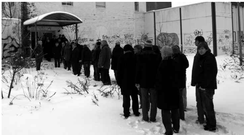
Die Enquetekommission vor Ort im ehemaligen Gefängnis und heutigen Menschenrechtszentrum Cottbus.