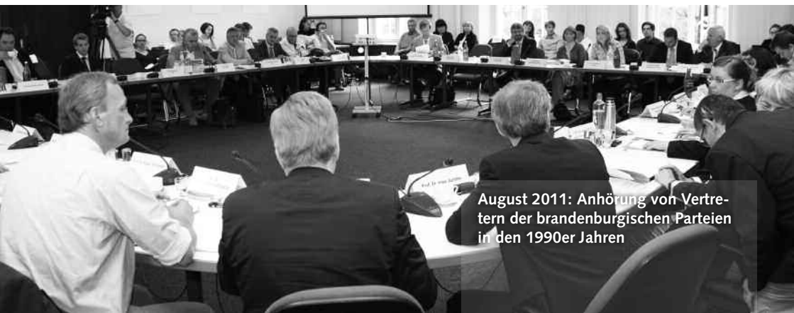
August 2011: Anhörung von Vertretern der brandenburgischen Parteien in den 1990er Jahren

6. Die Enquetekommission 5/1 regt gegenüber der Rechtsanwaltskammer an, dass Maßnahmen zur Aufarbeitung der eigenen Geschichte und der ihrer Mitglieder ergriffen werden."